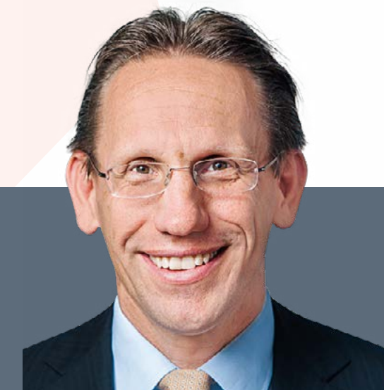
Dr. Jörg Kukies Staatssekretär, Bundesministerium der Finanzen